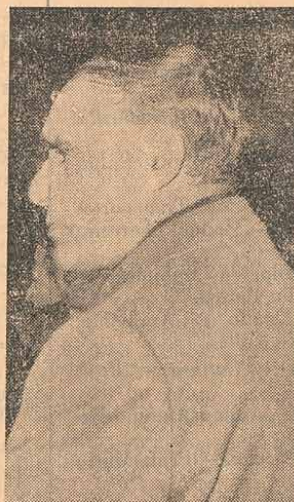
S. Exc.ª Presidente da República General António de Spínola

Tudo é novo, os homens e as ideias para «construir um País novo que Portugal há-de ser». Esses homens revitalizados pelo entusiasmo do povo, decerto se vão dedicar inteiramente à Nação, não desconhecendo, até porque S. Ex.º o Sr. Presidente da República o lembrou ao afirmar no acto de posse, que pesam sobre eles, e desde já, as maiores responsabilidades que alguma vez tocaram a governantes do País.