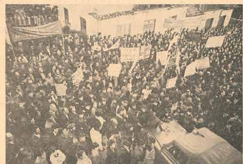
Imagem elucidativa do que foi a manifestação de apoio às Forças Armadas

Uma Pátria de negregados monopolistas escarranchados na árvore do governo, a permitir-se a vergonha de exportar, em chocante eufemismo negroiro, o cerne do trabalho português para viver, de-