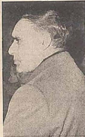
General António de Spínola

Dado por findo o prazo anunciado no manifesto das Forças Armadas e na proclamação da Junta de Salvação Nacional, e devolvido ao País e à consciência estrangeira o conceito de uma legalidade, ainda que provisória por um ano, podemos dizer que diminuíram apreensões.