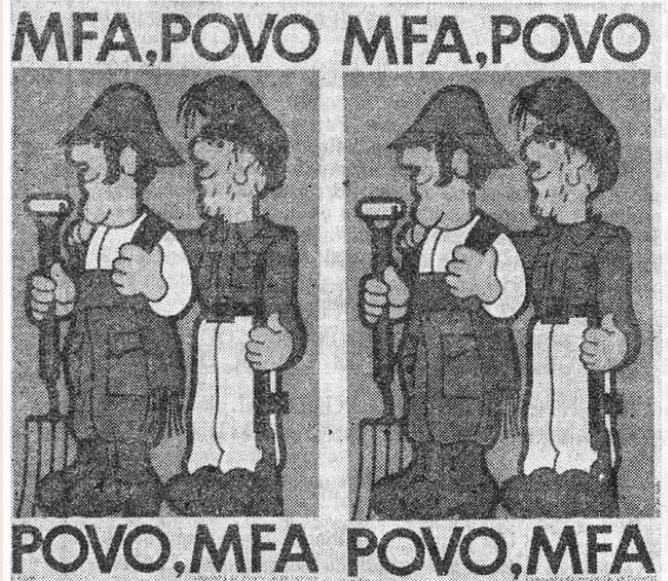
"A jornada do 11 de Março na vila de Cinfães" In: Miradouro , 22 de março de 1975, p. 1 e 5.