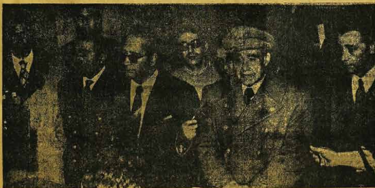
Aspecto da Conferência de Imprensa dada pelo General António de Spínola; após se ter libertado das ocupações mais urgente, provocadas pelas operações de "limpeza"